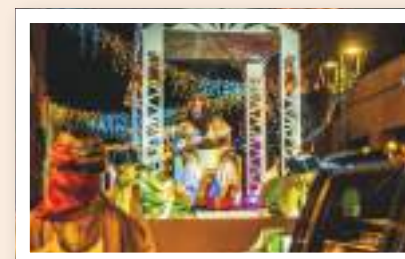
Second hand market