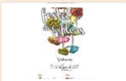
Festa de les flors