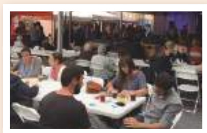
Fira de la cervesa