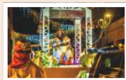
Festa dels reis