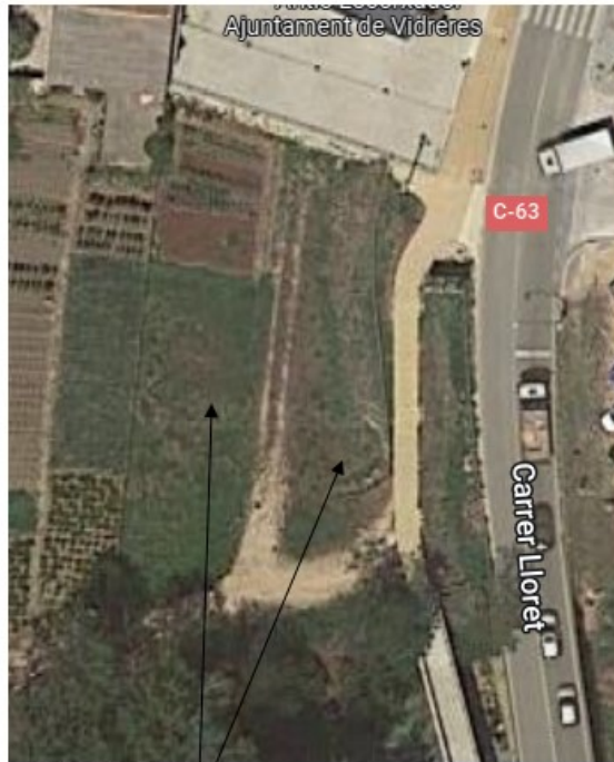
ZONA D'HORTS ZONA COMUNA