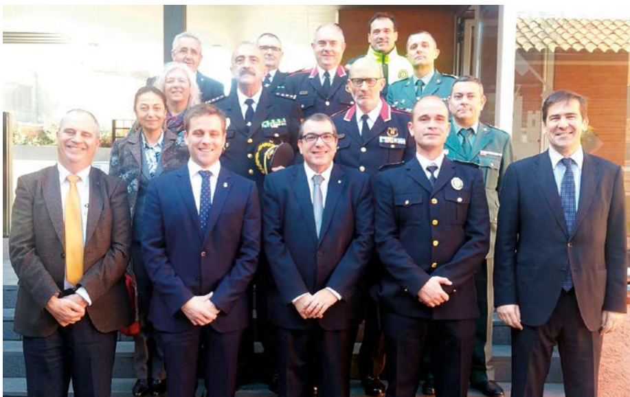
Fotografia dels assistents a la Junta de Seguretat celebrada a l'Ajuntament de Vidreteres