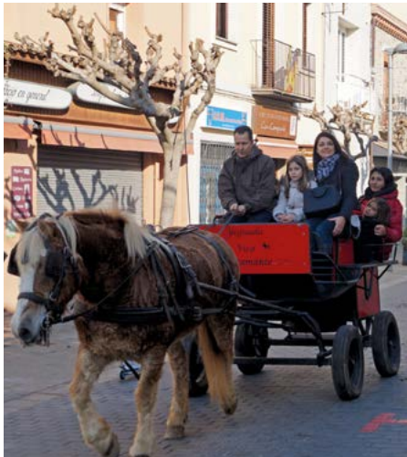
Marató TV3 2016