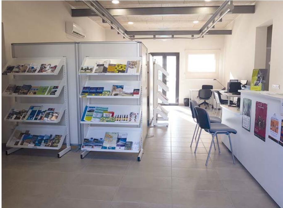
L'antiga Casa del Metge es convertirà en les noves oficines dels serveis socials i en un habitatge per emergències socials

La iniciativa formativa i de suport econòmic està organitzada per l'àrea de Promoció Econòmica de l'Ajuntament de Vidreres i es porta a terme a l'Antic Escorxador.