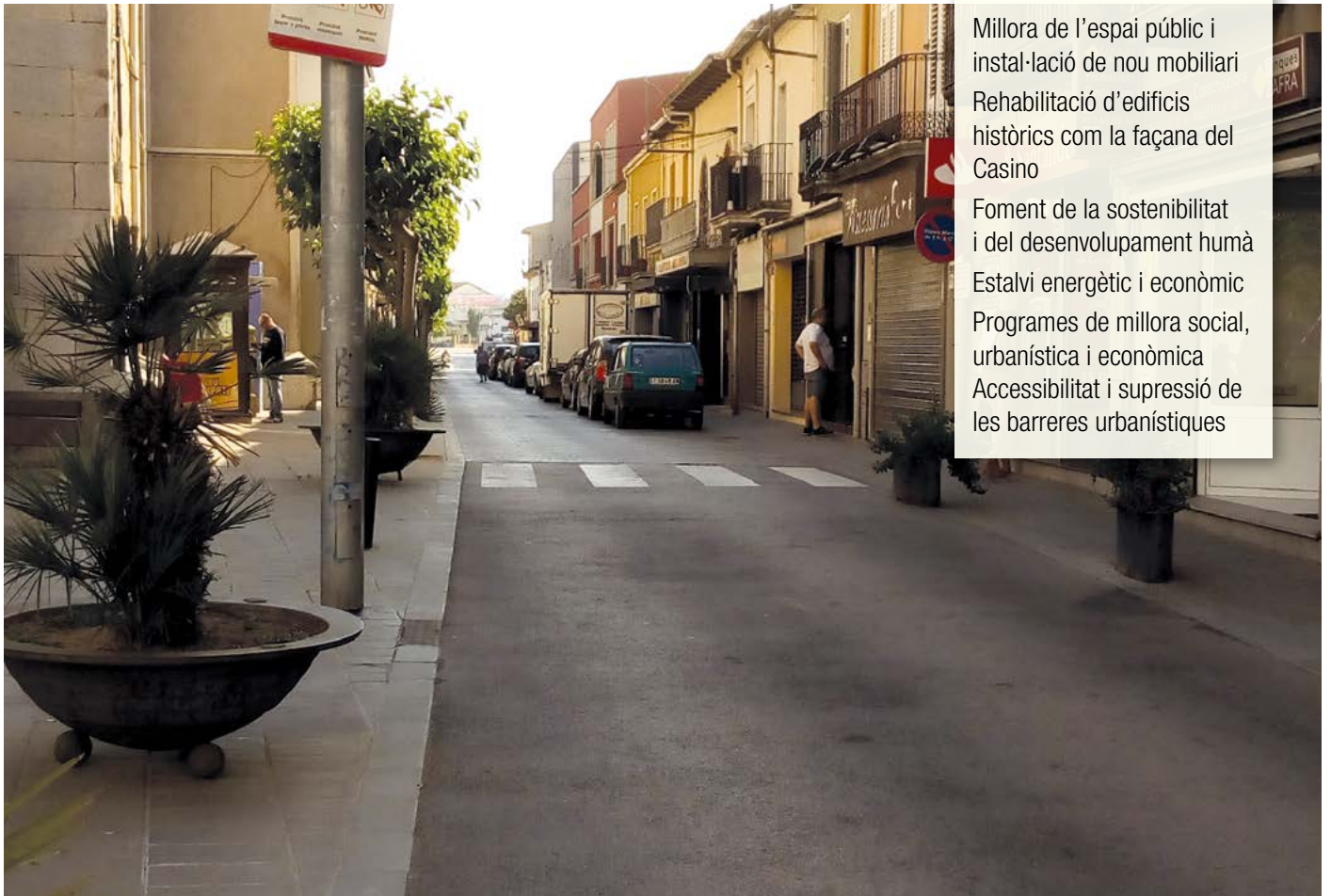
El casc antic del municipi recull diverses activitats promocionals, comercials i turístiques

Accessibilitat i supressió de les barreres urbanístiques