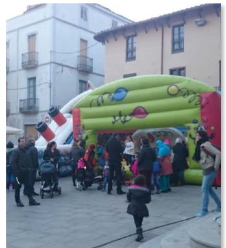
Festa Petita 2016