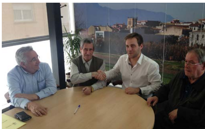
Ja és una realitat, signada la recepció de la Urbanització La Goba després d'un llarg procés d'acondicament de la urbanització