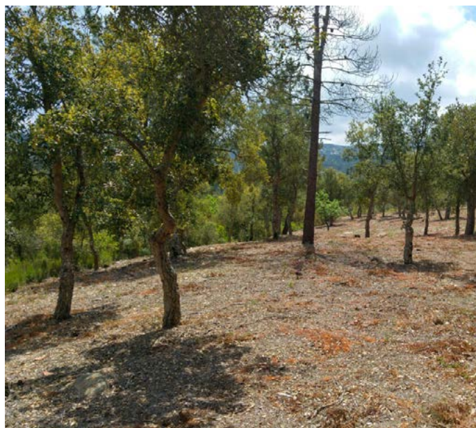
Les tasques permetran assegurar una franja al voltant dels habitatges que estigui lliure de vegetació seca i amb la massa arbòria aclarida.

L'Ajuntament de Vidreres ha portat a terme durant el passat mes d'abril i maig els tràmits per realitzar les tasques de manteniment de part de la franja de protecció contra incendis a les urbanitzacions de La Goba, Terrafortuna i Puigventós. Aquestes actuacions tenen com a objectiu reduir la càrrega de combustible dels límits de les urbanitzacions. D'aquesta manera es facilita l'actuació dels cossos de bombers i es redueixen els danys potencials en cas d'incendi. Les tasques consisteixen en una estassada del sotabosc, la tala d'alguns arbres i la poda de