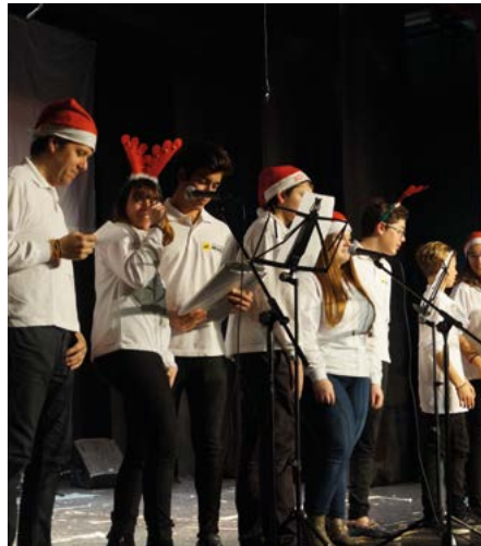
Concert Nadal de l'Escola de Música