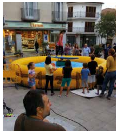
Fira de la Cervesa Artesana 2016