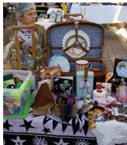
Flea Market Vidreres