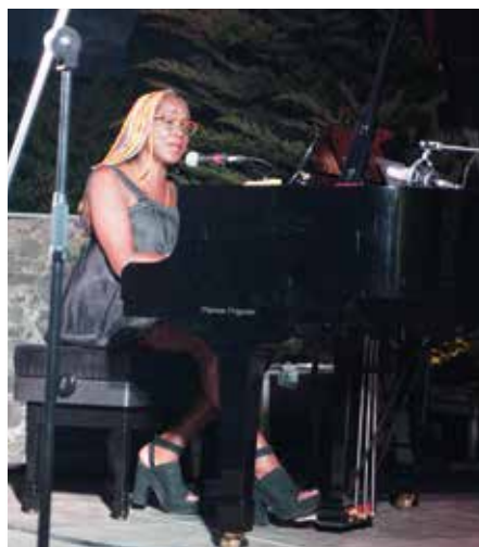
Festival de Jazz a la Fresca 2016