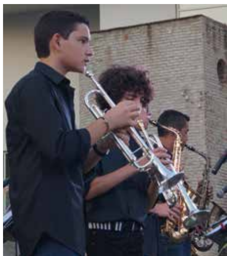
Festival de Jazz a la Fresca 2016