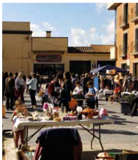
Flea Market Vidreres