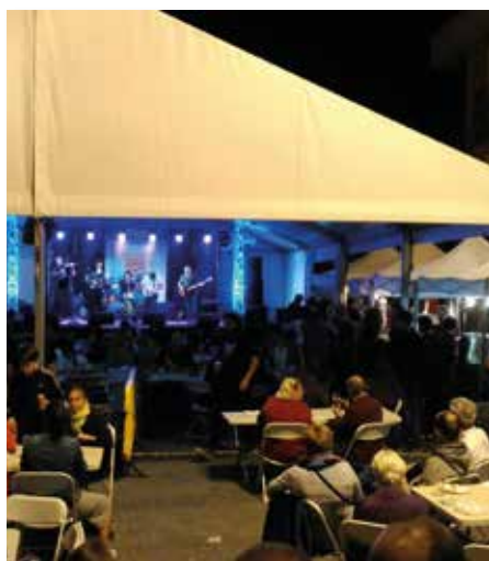
Fira de la Cervesa Artesana 2016